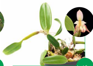
Jungle Plants Bulbophyllum ambrosia