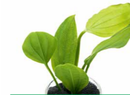
Jungle Plants Echinodorus argentinensis