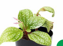
Jungle Plants Sonerila sp. "Phang Nga"