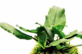
Jungle Plants Lagenandra meeboldii "Green"