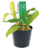
Jungle Plants (Orchideen)