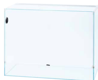
Neo Glass Paluda 60

Mit dem Neo Glass Paluda haben wir ein minimalistisches Paludarium-Becken im Programm, in dem man tropische Regenwaldpflanzen mit wenig Aufwand kultivieren kann. Es ist einfach zu pflegen, weil die vordere obere Glasabdeckung aufgeschoben werden kann und die Vorderseite ganz zu öffnen ist. Das 30 cm lange Neo Glass Paluda hat eine einzelne Schwingtür, das 60 cm lange Modell eine Doppeltür. Die Luftumwälzung im Becken und die Luftzufuhr und -abfuhr lässt sich mit dem Circulation Fan 40 (separat erhältlich) einfach steuern. Er wird in die entsprechende Öffnung an der Seite des Beckens eingesetzt.