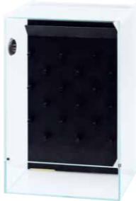
System Paluda 30

■ System Paluda 30 Abmessungen L30×B30×H45 (cm) Im Set enthalten Glasbecken, Mistflow Box, Wabi-Kusa Mat (×9), Umwälzpumpe (3 l/min,USB-A-Port), USB-Netzadapter (USB-A)*, Pumpenhalter, Auslassrohr, geräuschkämmender Schaumstoff (×2), hoch saugfähiger Schwamm, Paluda Clean PC, Glas-Schiebedeckel 30, Glas-Abdeckscheibe 30, Gitterabdeckung aus rostfreiem Stahl 30, Stopfen (Ø40×2), Entwässerungsstück, Vernebler Mistflow, Mistflow Cap, Circulation Fan 40, Cascade Brush S