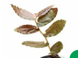
Jungle Plants Pellionia repens