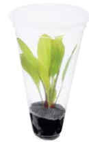
Jungle Plants (LC)

Wir haben unserer Produktpalette neue lebende Dschungelpflanzen hinzugefügt, die Jungle Plants. Hierfür wählen wir Arten wie Sumpfpflanzen, die über und unter Wasser in tropischen Urwaldbächen wachsen und Pflanzen wilder Schönheit, die eine hohe Luftfeuchtigkeit brauchen: kleine epiphytische Orchideen, Begonien, Farne und Aronstabgewächse. Sie finden in dieser Linie eine große Auswahl an sehr verschieden aussehenden Pflanzen. ADA wird dieser Produktlinie auch in Zukunft neue Pflanzentypen und weitere lebende Produkte hinzufügen.