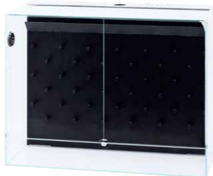
System Paluda 60

■ System Paluda 60 Abmessungen L60×B30×H45 (cm) Im Set enthalten Glasbecken, Mistflow Box, Wabi-Kusa Mat (×18), Umwälzpumpe (3 l/min,USB-A-Port), USB-Netzadapter (USB-A)*, Pumpenhalter, Auslassrohr, geräuschkämmender Schaumstoff (×2), hoch saugfähiger Schwamm (×2), Paluda Clean PC, Glas-Schiebedeckel 60, Glas-Abdeckscheibe 60, Gitterabdeckung aus rostfreiem Stahl 60, Stopfen (Ø40×2), Entwässerungsstück, Vernebler Mistflow, Mistflow Cap, Circulation Fan 40, Cascade Brush S