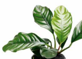
Jungle Plants Anubias barteri "Coffeefolia"