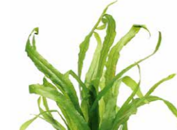
Jungle Plants Microsorium sp. "Trident"