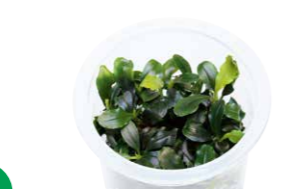
Jungle Plants Bucephalandra sp. "sintang"