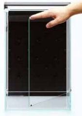
System Paluda 30 mit Einzelschwingtür

Beim System Paluda handelt es sich um ein Komplett-Paludarium, das speziell von ADA für die Haltung tropischer Regenwaldpflanzen entwickelt wurde. An der Rückwand des Beckens sitzt eine Vernebler-Aufnahme für unseren Mistflow. Im System Paluda lässt sich mit Hilfe unseres Luftumwälzers Circulation Fan 40 eine gleichmäßig hohe Luftfeuchtigkeit aufrecht erhalten, in der sich tropische Regenwaldpflanzen sehr wohl fühlen. Der Lüfter wird über unsere smarte Steckerleiste Power Cord S-70 betrieben. Zusätzlich entfernt der mitgelieferte hoch saugfähige Schwamm überschüssiges vernebeltes Wasser, das sich am Boden des Beckens sammelt. Dieses System erlaubt Ihnen, die Pflanzen ohne störende Details zu genießen; hier brauchen wir keinen doppelten Boden oder einen störenden Auslaufhahn. Ersetzt man das entkalkende Filtermedium Paluda Clean PC in der Mistflow Box regelmäßig, kann man störende Kalkflecken auf dem Glas reduzieren. Auch notwendige Pflegearbeiten lassen sich einfach durchführen, weil die vordere obere Glasabdeckung aufgeschoben werden kann und die Vorderseite ganz zu öffnen ist; das System Paluda 30 hat eine einzelne Schwingtür, beim System Paluda 60 ist es eine Doppeltür. Die Vernebleraufnahme kann zur einfacheren Pflege abgenommen werden. Um vollautomatisch zu laufen, braucht man für das Paludariumsystem die separat erhältliche smarte Steckerleiste Power Cord S-70.