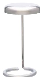
Mistflow Cap Am Vernebler Mistflow angebracht