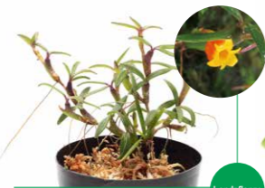
Jungle Plants Mediocalcar decoratum "Orange"