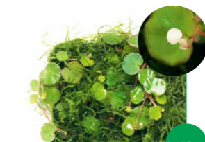
WABI-KUSA Mat Begonia lichenora