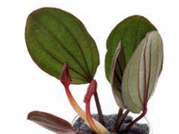
Jungle Plants Echinodorus Joyo Red Star