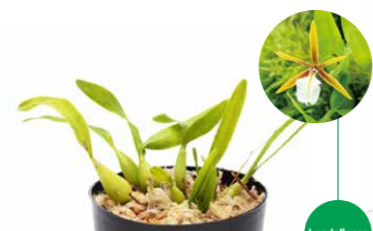
Jungle Plants Dinema polybulbon